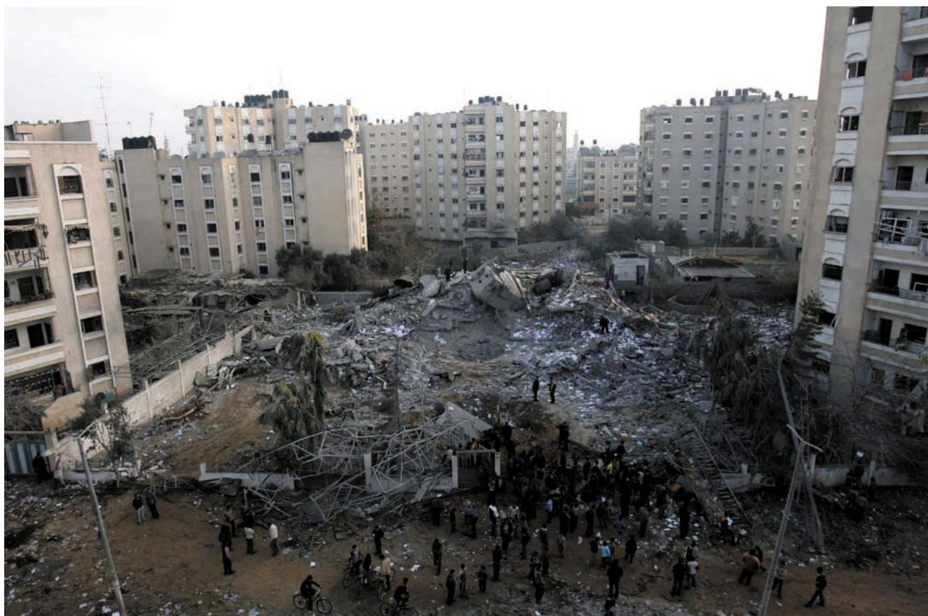
Israël bombardeerde vakbondshoofdgebouw in Gaza