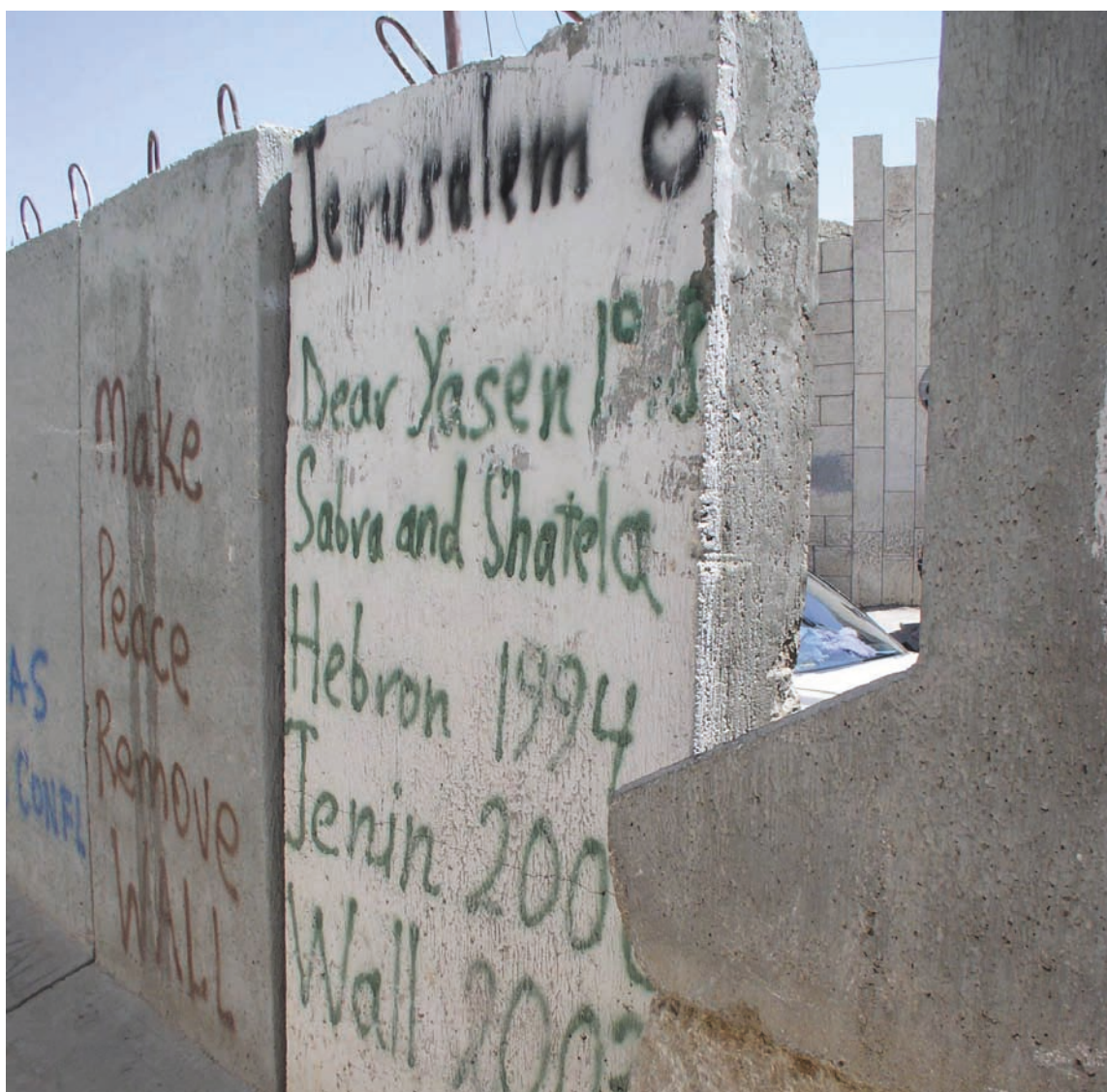
Stuk Muur met data

Een vakbondsdossier: http://www.palestina-komitee.nl/dossiers/16