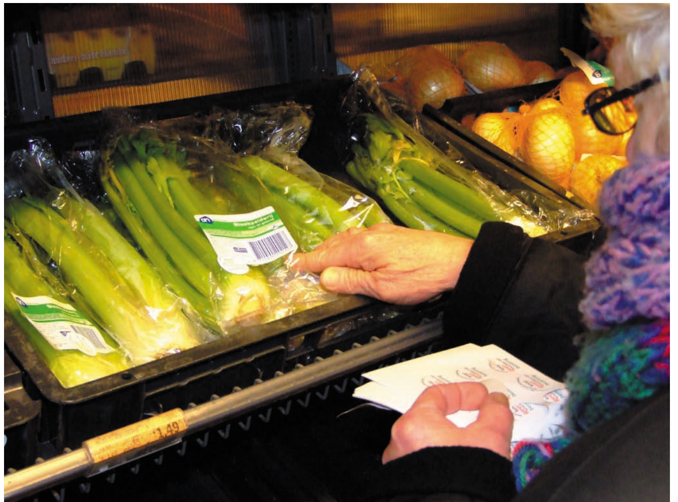
Schap bij AH: Bleekselderij "uit Israël". Of misschien uit een nederzetting? Beter maar helemaal niet kopen. Een Haarlemse activiste plakt stickers: "koop geen vruchten van bezetting".

ten. Het zal de PEACE-actie zeker makkelijker maken als de handel schade ondervindt doordat alle Israëlische producten minder verkocht gaan worden. Dan zal het economisch lonend worden om voortaan toch maar eerlijk te zijn met die etiketten.